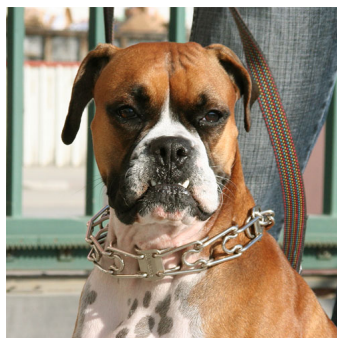
Collier sprenger en acier inoxydable