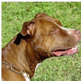
Collier etrangeur laiton à grosse maille