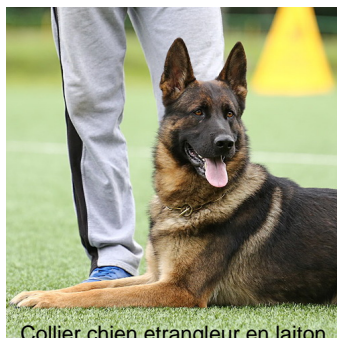
Collier chien etrangleur en laiton