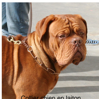
Collier chien en laiton